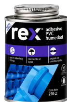
Adhesivo PVC humedad 250 ml 30415